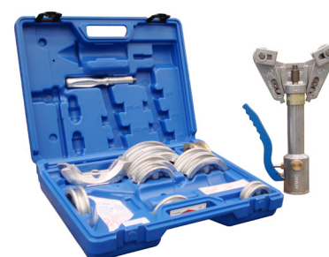
Art. 0101 (kit) Art. 0101-OD (kit OD)